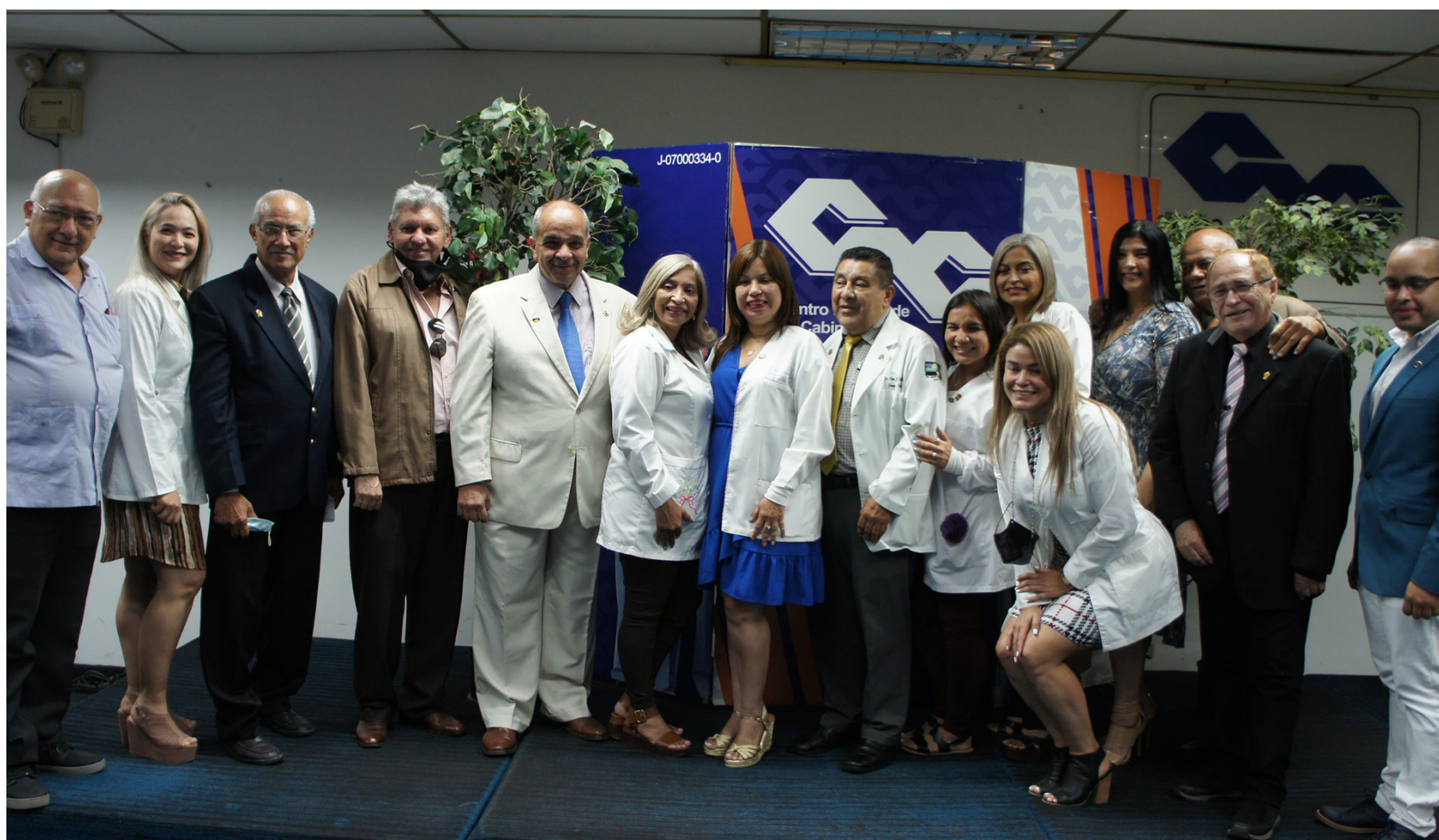
Parte del personal del CMC celebró el Día del Médico este 15 de marzo.